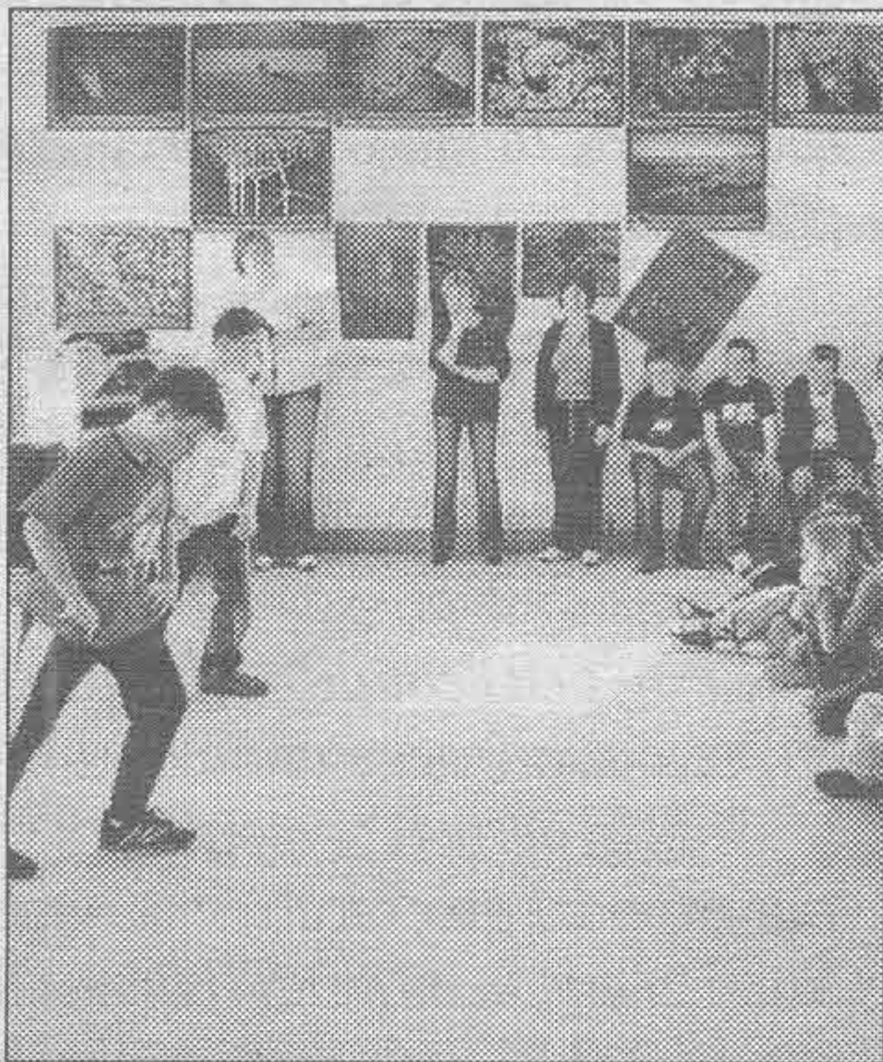
■ Démonstration de country