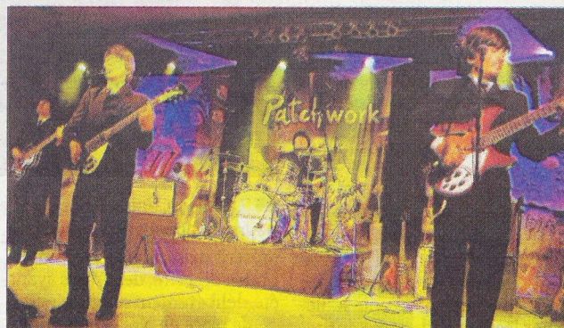
Le groupe Patchwork a fait revivre les Beatles