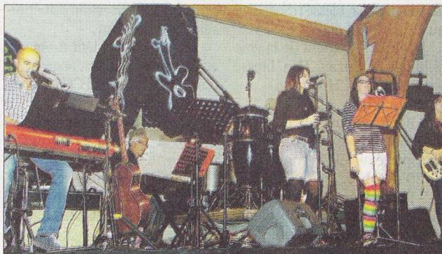
Sur scène deux formations locales également