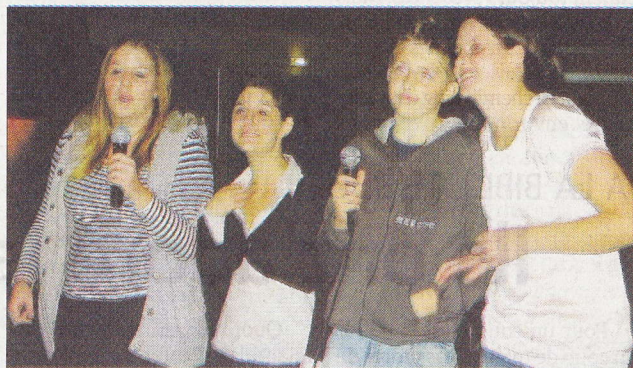
Tant pis pour les couacs, l'essentiel était de participer