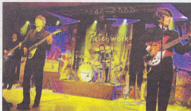
Le groupe Patchwork a fait revivre les Beatles