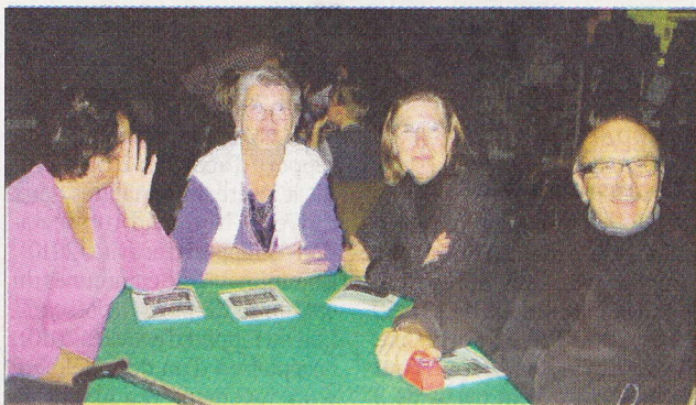
Les uns sont venus chanter, les autres écouter